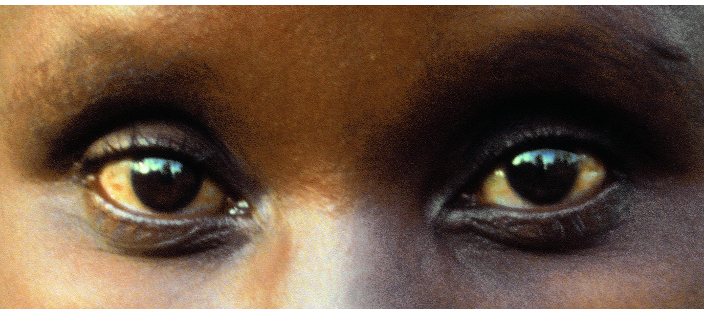
阿尔弗雷多·贾尔 戈迪特·埃梅里塔的眼睛 单频彩色无声录像 1996 1'43"