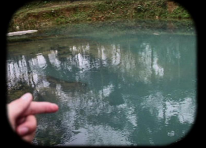
阮纯诗 风景系列 #1 单频彩色有声录像 2013 4'55'