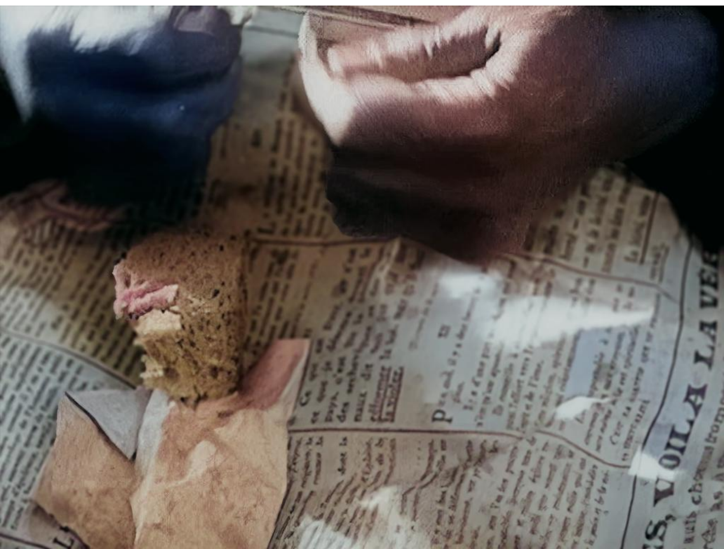
埃德·阿特金斯 这就是真相 单频彩色有声影像 2022 3'49''