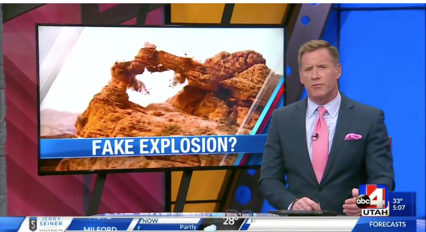
朱利安·夏利耶, 朱利叶斯·冯·裨斯麦 在现实世界中, 事情并没有那么完美 多频彩色有声影像装置(两频彩色有声循环影像与现场新闻频道) 2019 17'32"