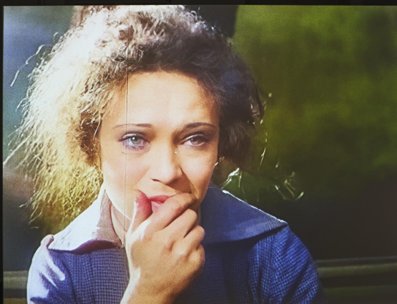
埃德阿特金斯Ed Atkins 这就是真相This is the Truth 2022 3'49"