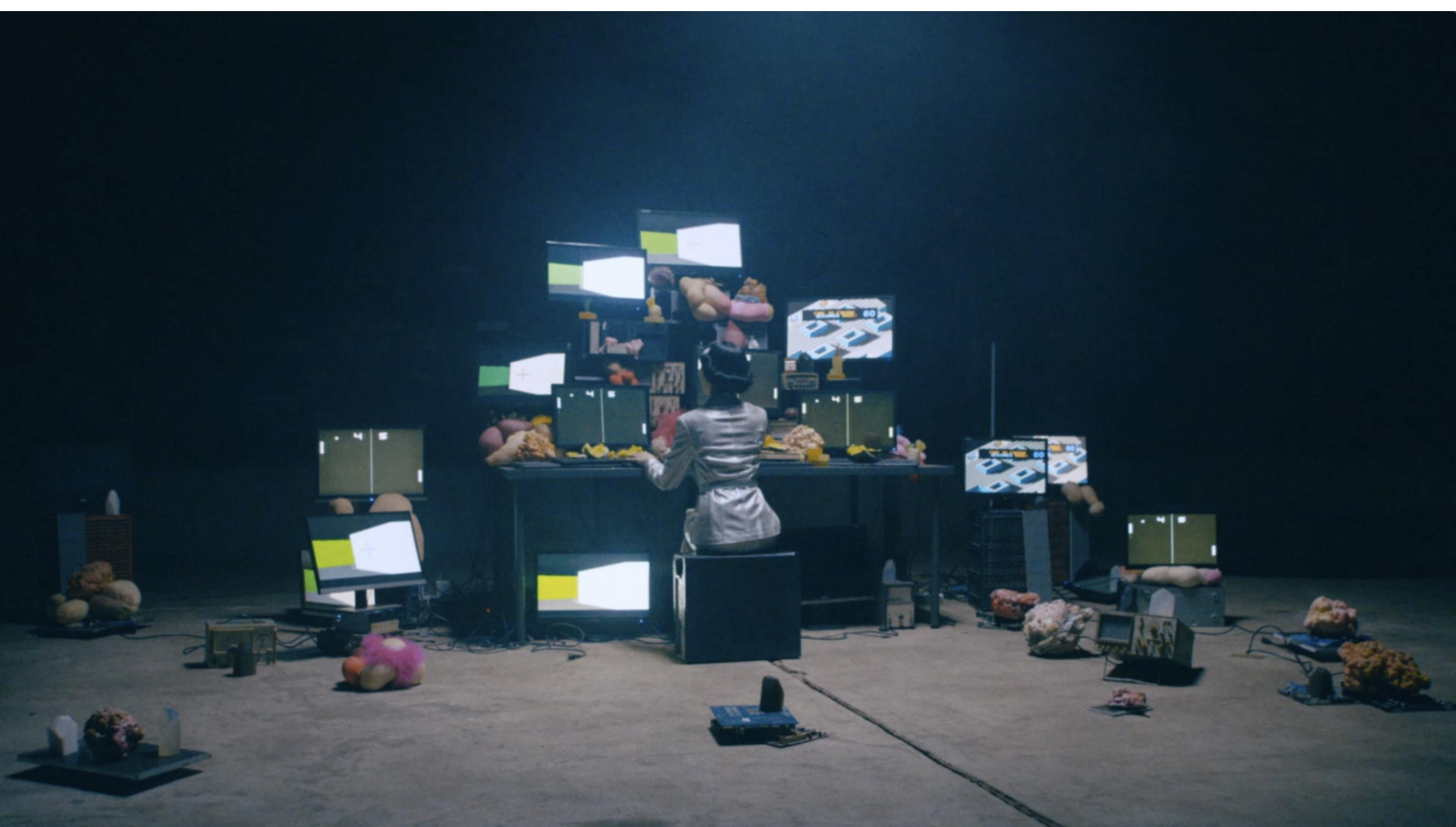
张硕尹 肥皂SOAP 2021 17'31"