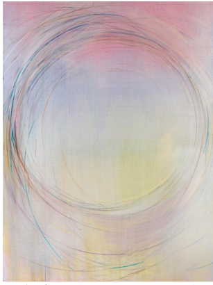
《有体积的圆》，2023，布面丙烯，250 × 190 厘米 Circle with Volume , 2023, acrylic on canvas, 250 × 190 cm

在艺术家近期的创作中，复杂而交织的线条开始不断地生长于图层之间，并与和谐且微妙的色调相融合。以《有体积的圆》（2023）为例，作品以画圆的动作和行为作为触发点，将重复的圆形轨迹和轻薄且透明的色层紧密地交织和叠加。线条沿着圆这一形状描绘和偏移于一种介于心理和想象层面的临界值边缘，仿佛一种无形的标准和传统造型在相互并置，同时对动作的不断实践和想象又扩展出一个诗意的空间：仿佛风吹过，留下了优雅痕迹。