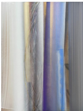
《极紫外#4》，2023，布面丙烯、喷漆，150 × 120 厘米 Extreme Ultra-violet #4 , 2023, acrylic, spray paint on canvas, 150 × 120 cm

在艺术家近期的创作中，复杂而交织的线条开始不断地生长于图层之间，并与和谐且微妙的色调相融合。以《有体积的圆》（2023）为例，作品以画圆的动作和行为作为触发点，将重复的圆形轨迹和轻薄且透明的色层紧密地交织和叠加。线条沿着圆这一形状描绘和偏移于一种介于心理和想象层面的临界值边缘，仿佛一种无形的标准和传统造型在相互并置，同时对动作的不断实践和想象又扩展出一个诗意的空间：仿佛风吹过，留下了优雅痕迹。