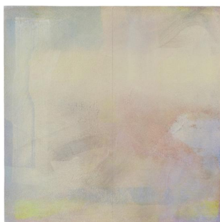
《无题#201904》，2019，木板丙烯，50 × 50 厘米 Untitled #201904 , 2019, acrylic on wood, 50 × 50 cm

乔空间欣然呈现王志渊个展“域值”，本次展览展出艺术家在过去几年中创作的十四件作品，梳理了他的艺术实践之旅，体现出其近几年关于绘画的思考和变化，以及他对“绘画基础”的理解和实践。展览呈现了艺术家对于颜色、材料和光影变化的不断探寻，以及对痕迹、动作和绘画行为的反复审视。展览标题“域值”将色域绘画中关于空间场域的“域”字糅合进意味着临界状态的“阈值”一词，不仅示意着“艺术家本人对于当代绘画之外的领域所持续保持的关注、观察与借鉴”，也昭示着一种“潜于创作之中、平静之下的蜕变和超脱”。 [1]