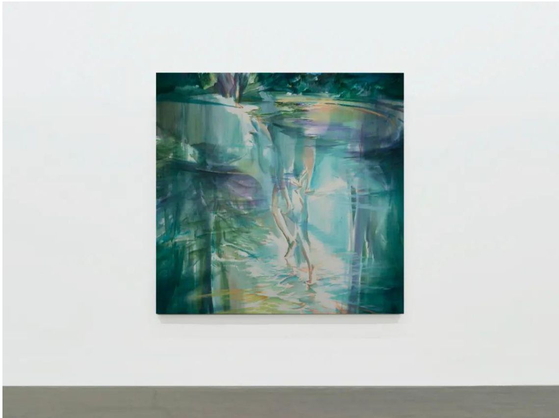
史成栋《浮光掠影》布面油画 180×180cm 2023

今格空间：在对于《浮光掠影》的介绍中，你提到希望呈现出一种每个人都会遇到的迷惘时刻，这似乎是某种非积极的状态，这种不积极的状态与“和光前行”带给人的积极和希望似乎是不一致的，你如何看待这种状态？