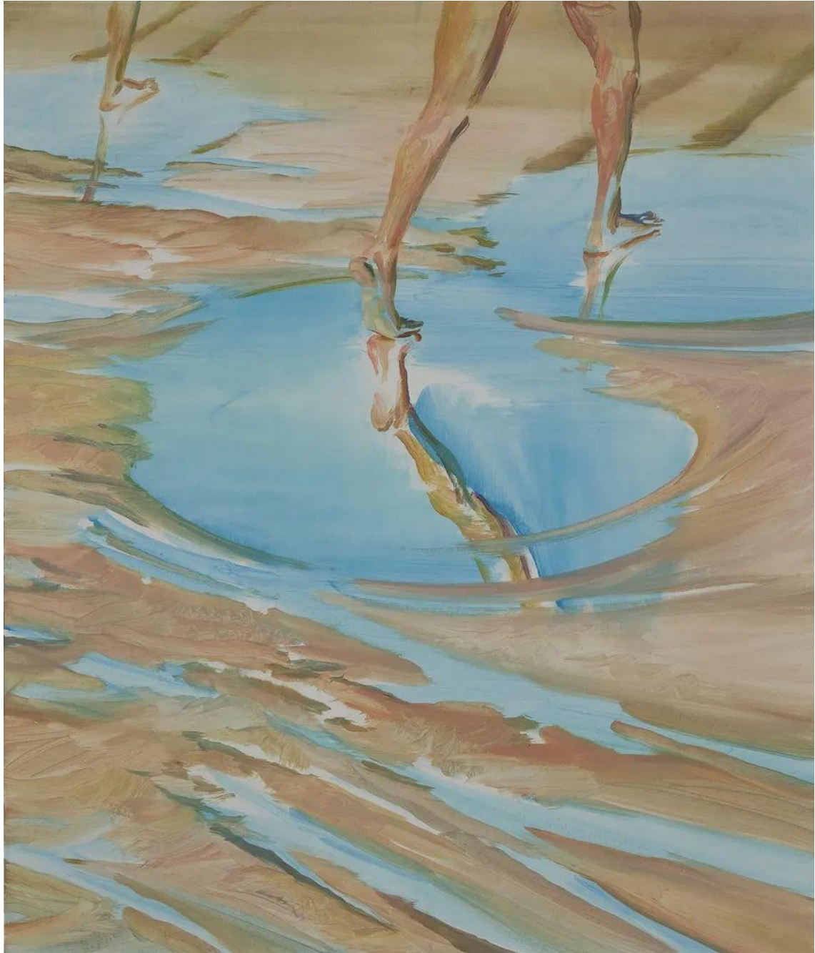
史成栋《前行者》布面油画 60×70cm 2023

今格空间：马尔库塞在《单向度的人》中讨论的是发达工业社会的科技理性对于人本身的压迫和异化，对于这个问题，马尔库塞提出的解决办法正是通过艺术来唤醒人们的精神世界，你在创作《前行者》时是否也怀着这样一种初衷？