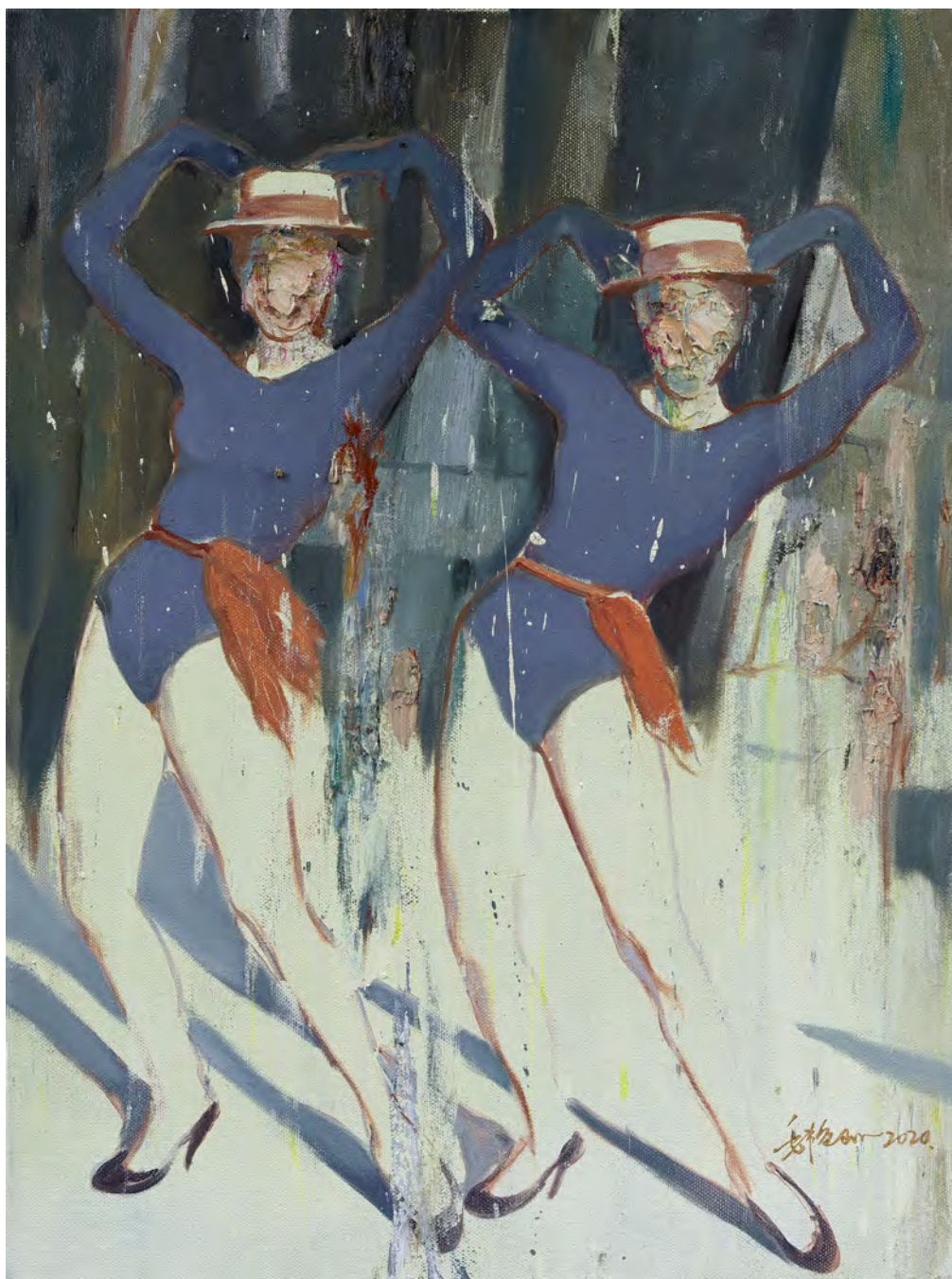
美丽生活之八 / Beautiful life No.8