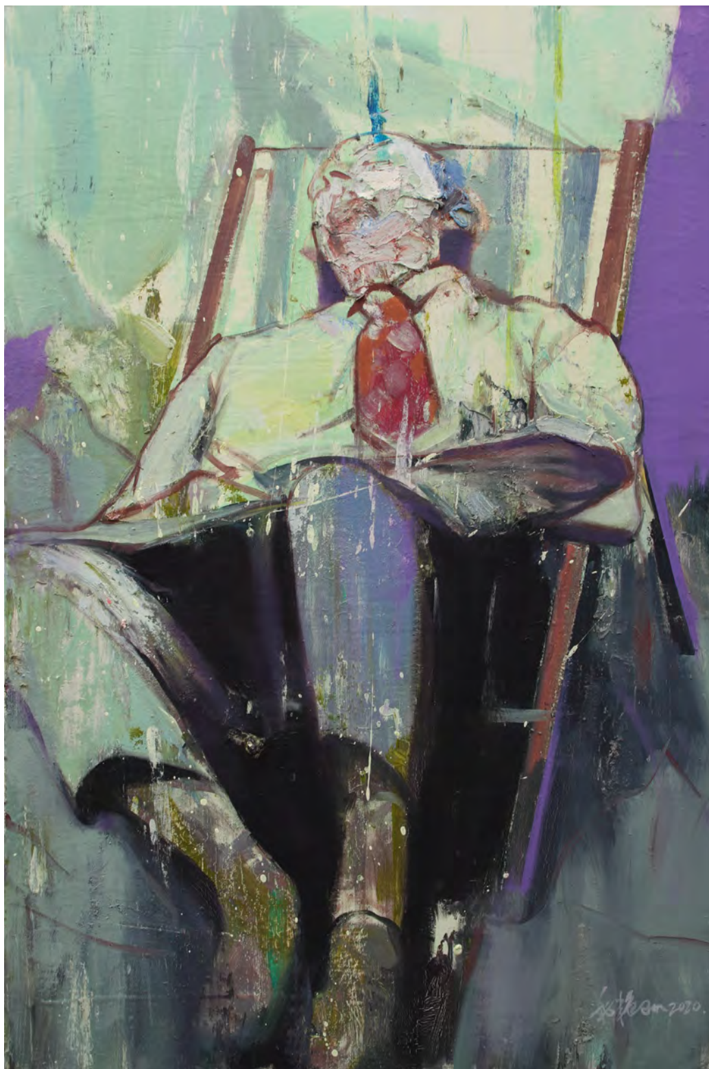
美丽生活之六 / Beautiful life No.6