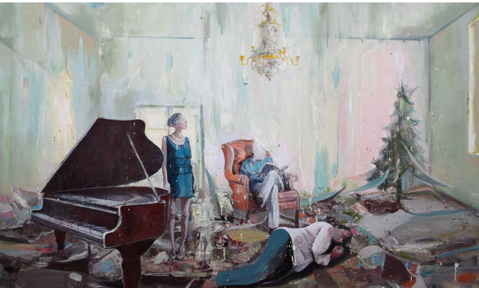
美丽生活之一 / Beautiful life No.1