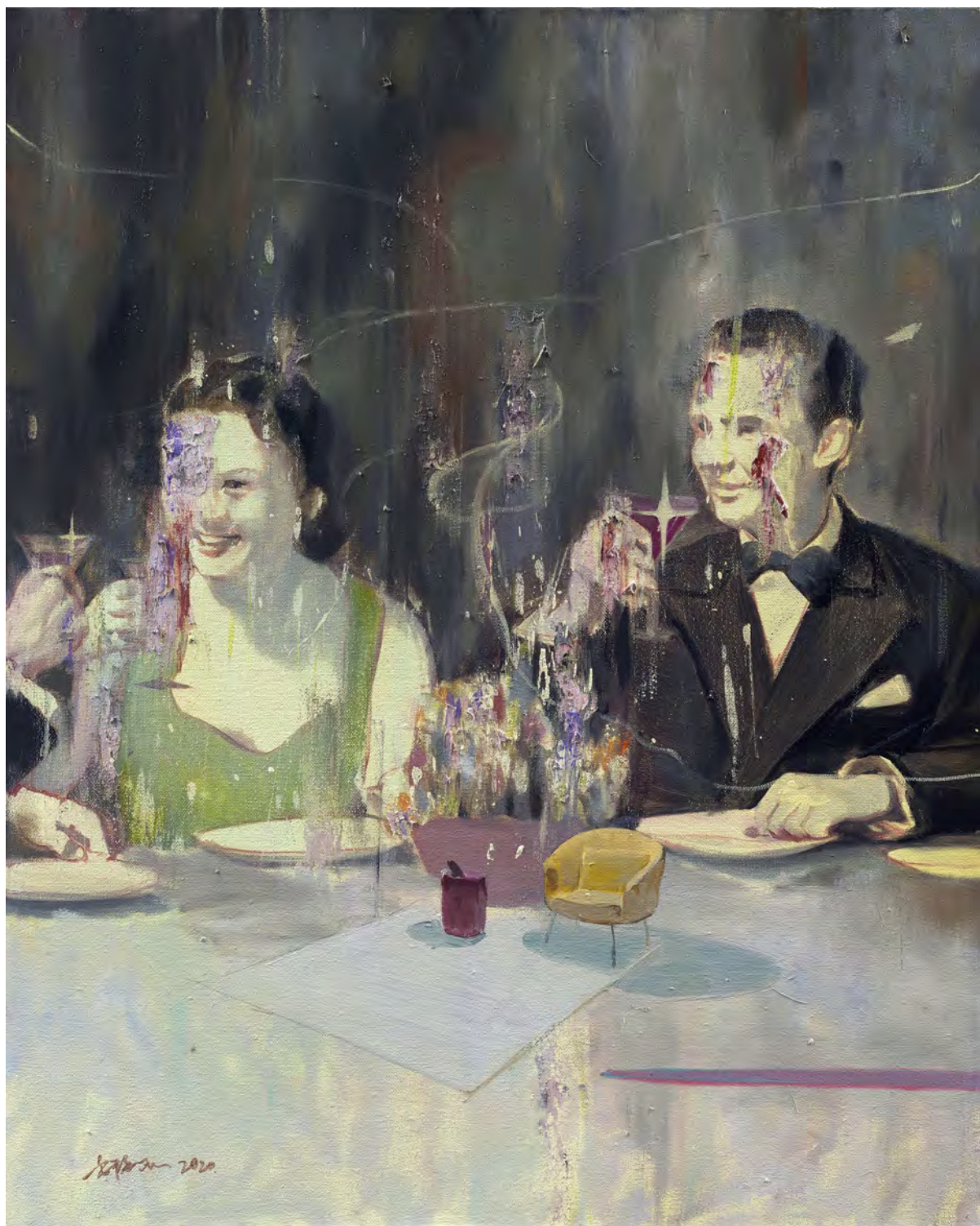
美丽生活之十一 / Beautiful life No.11