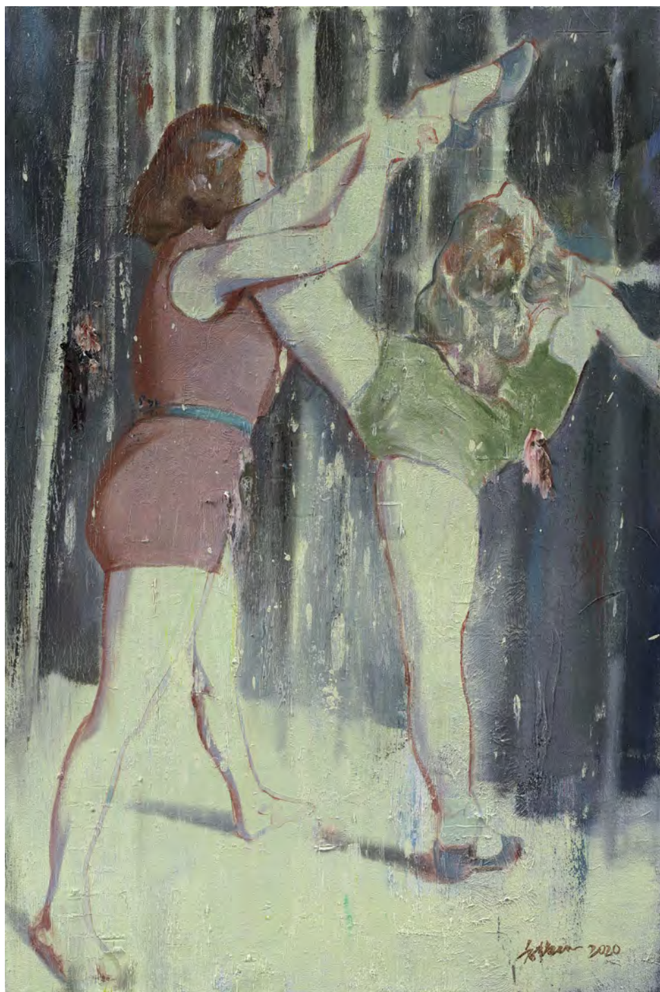
美丽生活之十 / Beautiful life No.10