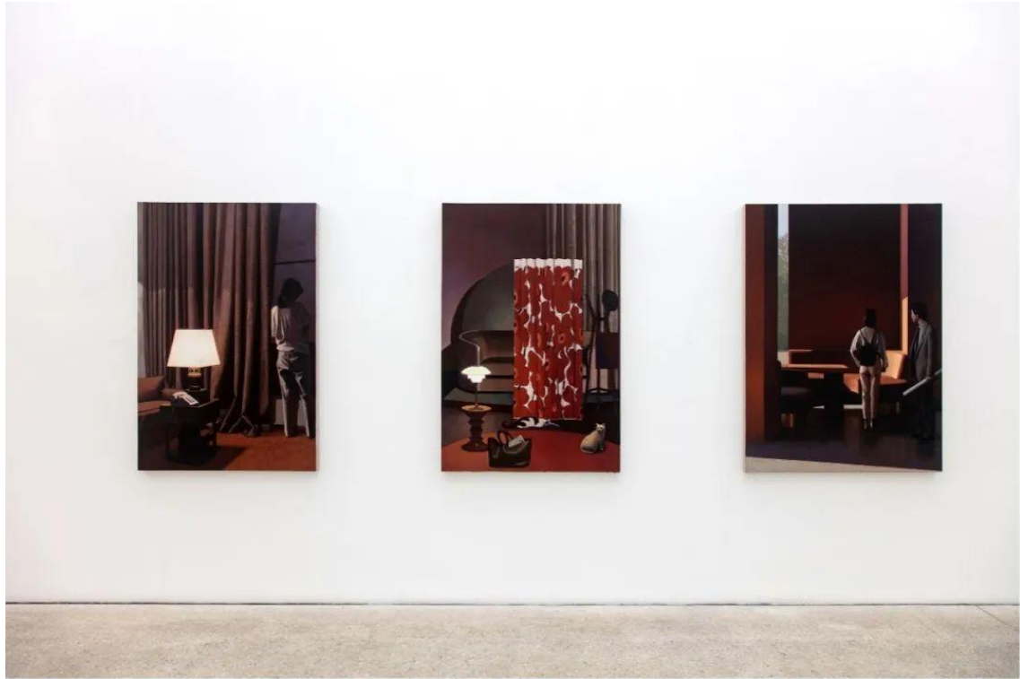
拾光，于悠深处，站台中国展览现场，2023