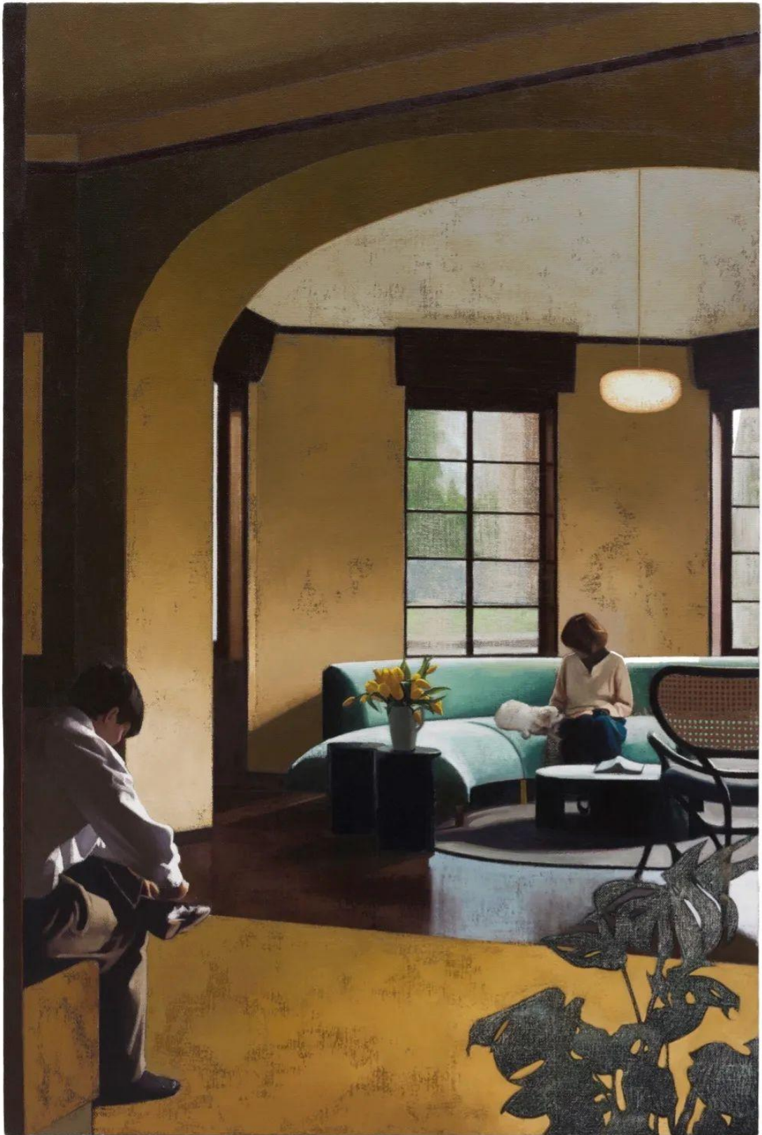
今天有雨 Today is rainy, 布面油画, 150X100cm, 2022