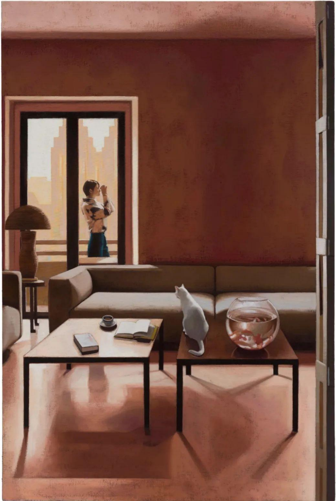
哪呢 Where 布面油画, 150x100cm, 2022