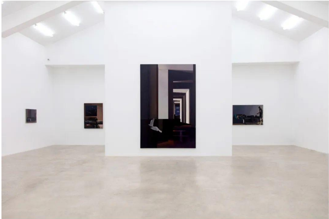
拾光，于悠深处 站台中国展览现场，2023

对于我这个有两个孩子的人来说，家庭生活会占据我的很大部分时间，所以画画是我的唯一爱好吧。