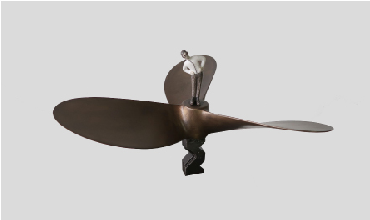
《有强烈变身欲望的我》 铁 黄铜 模型膏 22x38x38cm 2023 Me with A Burning Desire of Transfiguration Iron, Brass, Modeling paste 22x38x38cm 2023