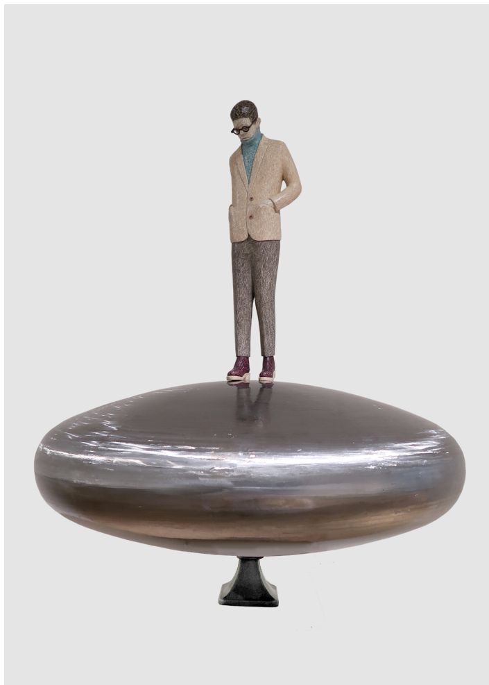
《她曾生活的城市》铁 模型塑膏 70.5x60x60cm 2023 The City She Lived In Iron, Modeling Paste 70.5x60x60cm 2023