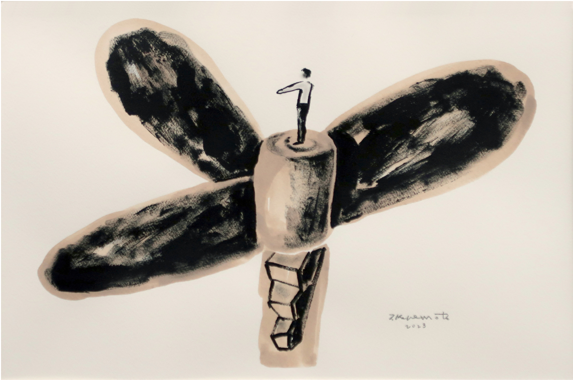
《并非紧急降落 II》 纸 丙烯 墨 38x53.5cm 2023 No Forced Landing II Acrylic and ink on paper 38x53.5cm 2023