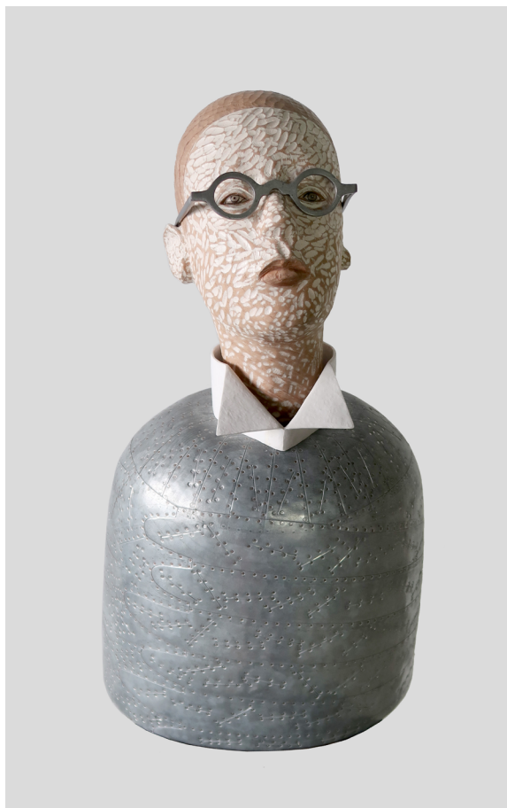
《你变成大人了吗》 镀锡钢板 木 模型膏 58x32x23cm 2023 Have You Become an Adult Iron, Tinplate, Wood, Modeling paste 58x32x23cm 2023