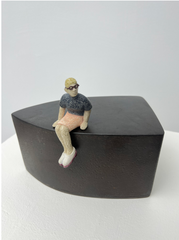
《不知去向何处》 铁 模型膏 14x16.5x12cm 2024 Do Not Know Where to go Iron, Modeling paste 14x16.5x12cm 2024