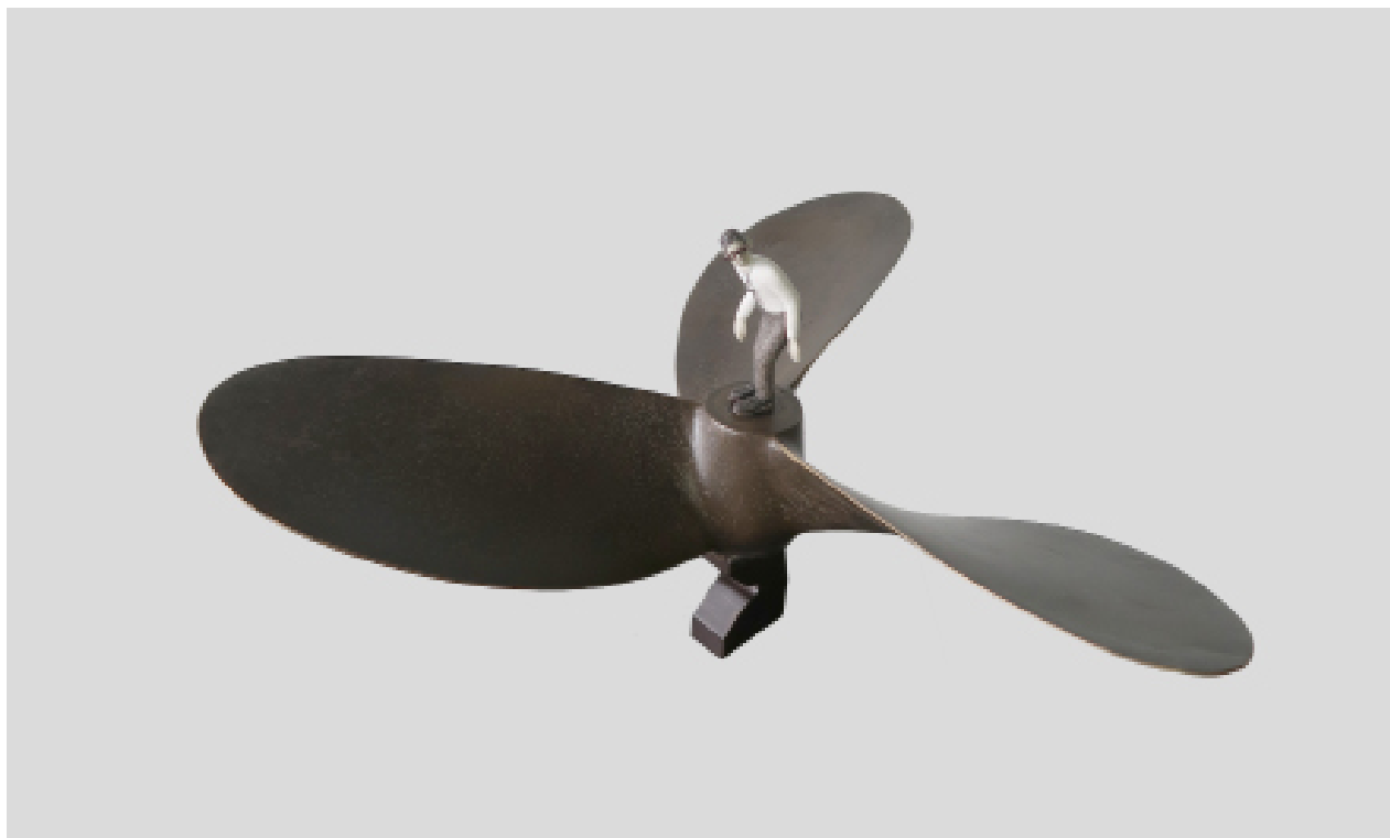
《开始的预感》 铁 黄铜 模型膏 22x42.5x42.5cm 2023 The Hunch of Beginning Iron, Brass, Modeling paste 22x42.5x42.5cm 2023