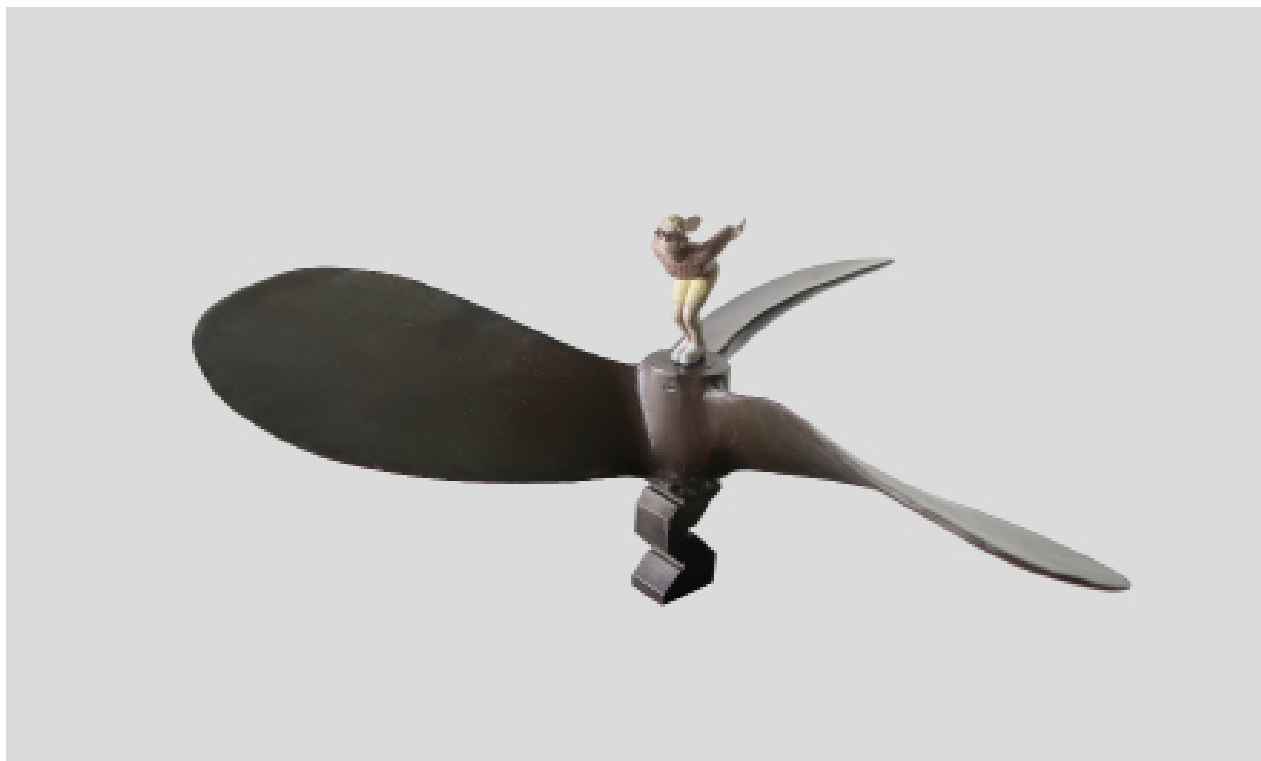
《轻柔的风》 铁 黄铜 模型膏 18.5x38.5x38.5cm 2023 Gentle Wind Iron, Brass, Modeling paste 18.5x38.5x38.5cm 2023