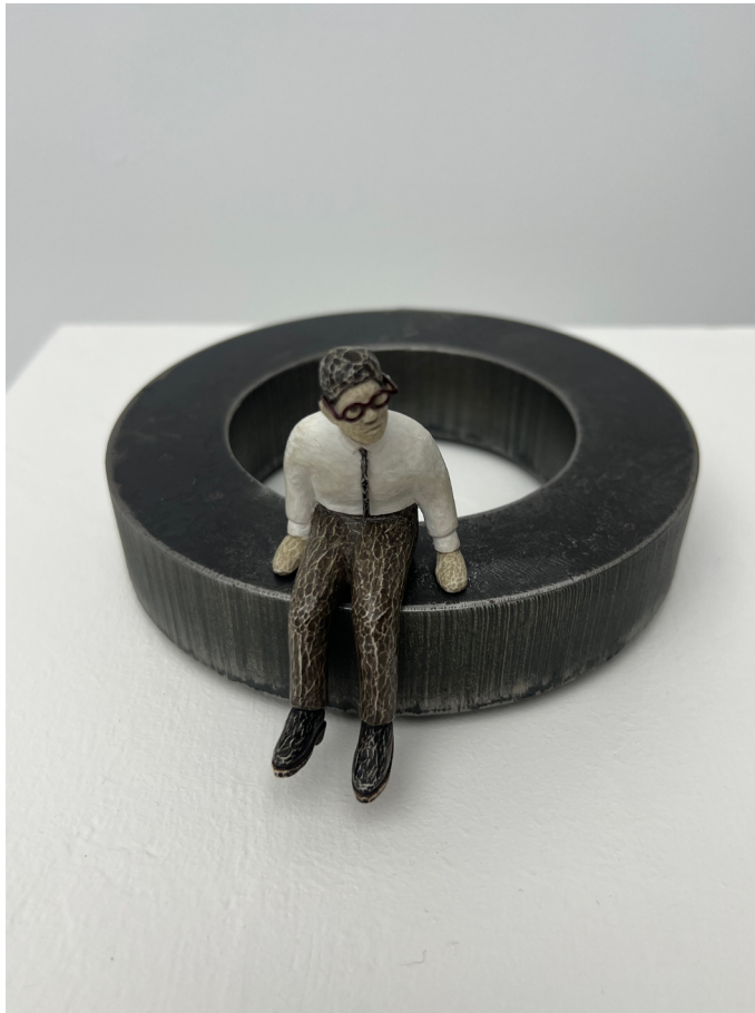
《永葆青春的男子》铁 模型膏 9x15x17.5 cm 2024 A Man of Eternal Youth Iron, Modeling paste 9x15x17.5 cm 2024