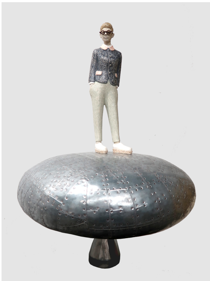
《留在心中的风景》铁 镀锡钢板 木 模型膏 43.5x30.5x30.5cm 2023 The Scenery Carved in Heart Iron, Tinplate, Wood, Modeling paste 43.5x30.5x30.5cm 2023