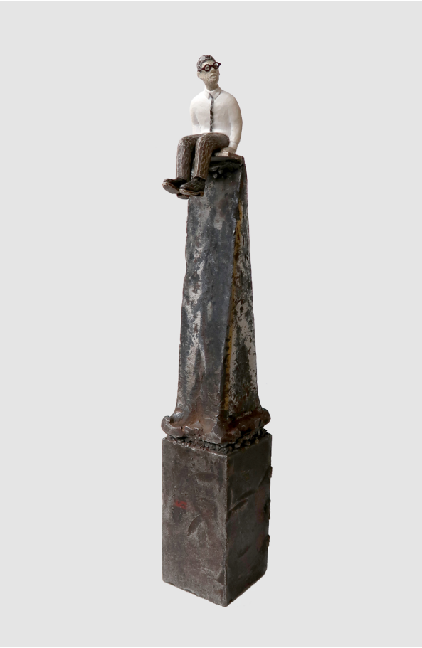
《天挂彩虹》铁 模型塑膏 32x50x50cm 2023 A Rainbow Hangs in the Sky Iron, Modeling Paste 32x50x50cm 2023