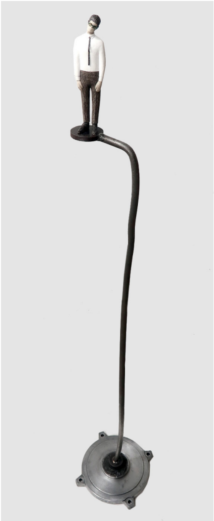
《忍耐的平衡》铁 铝 模型膏 162x32x32cm 2023 Balance of Patience Iron, Aluminium, Modeling paste 162x32x32cm 2023