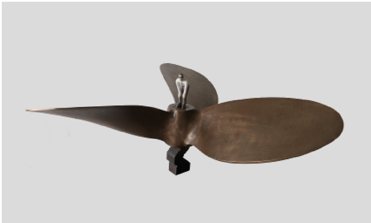
《远而近》铁 黄铜 模型膏 26x60x60cm 2023 Far and Near Iron, Brass, Modeling paste 26x60x60cm 2023