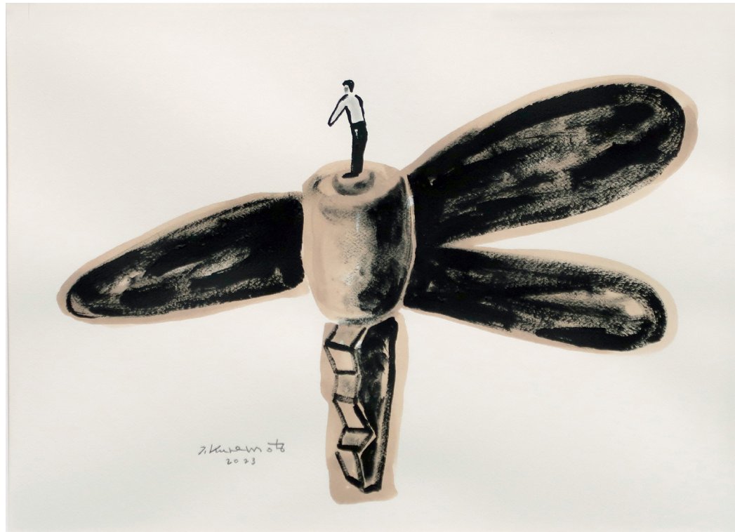
《并非紧急降落 I》 纸 丙烯 墨 38x53.5cm 2023 No Forced Landing I Acrylic and ink on paper 38x53.5cm 2023