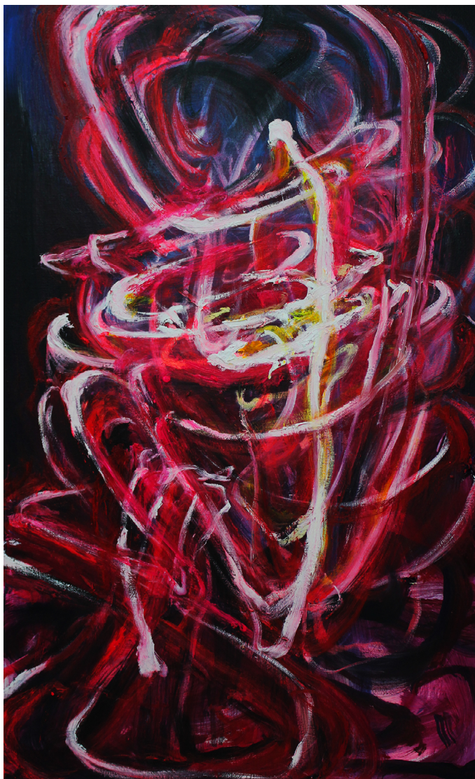
《呼唤黑暗，压抑黑暗》130 x 80 cm 布面油画 2023 Call for Darkness, Suppress Darkness 130 x 80 cm Oil on canvas 2023