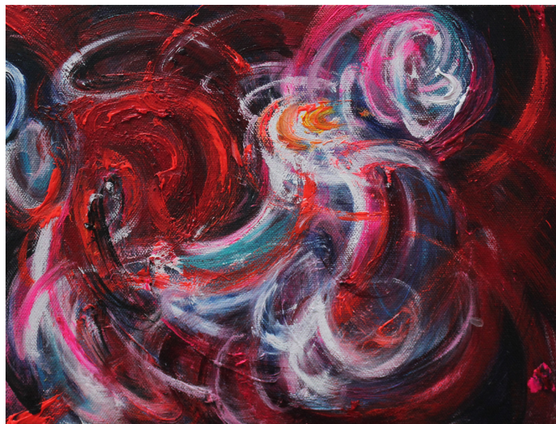
《湍流》 30 x 40 cm 布面油画 2023 Turbulence 30 x 40 cm Oil on canvas 2023