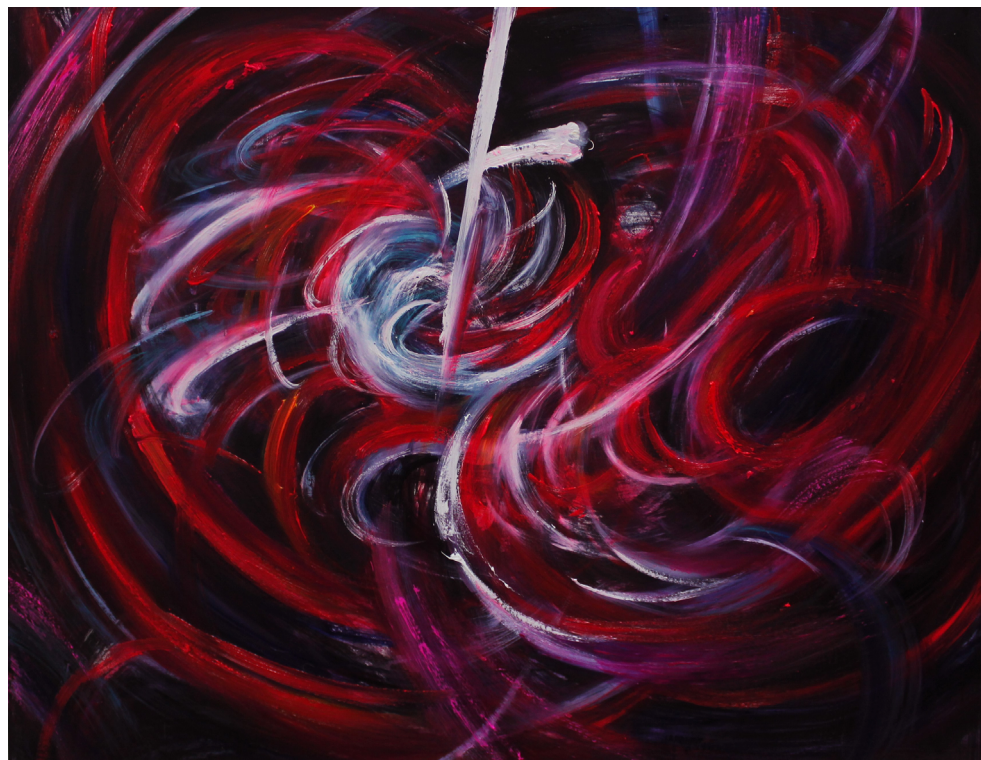
《现象》70 x 90 cm 布面油画 2023 Phenomenon 70 x 90 cm Oil on canvas 2023