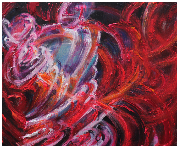
《相拥》40 x 50 cm 布面油画 2023 Embrace Each Other 40 x 50 cm Oil on canvas 2023