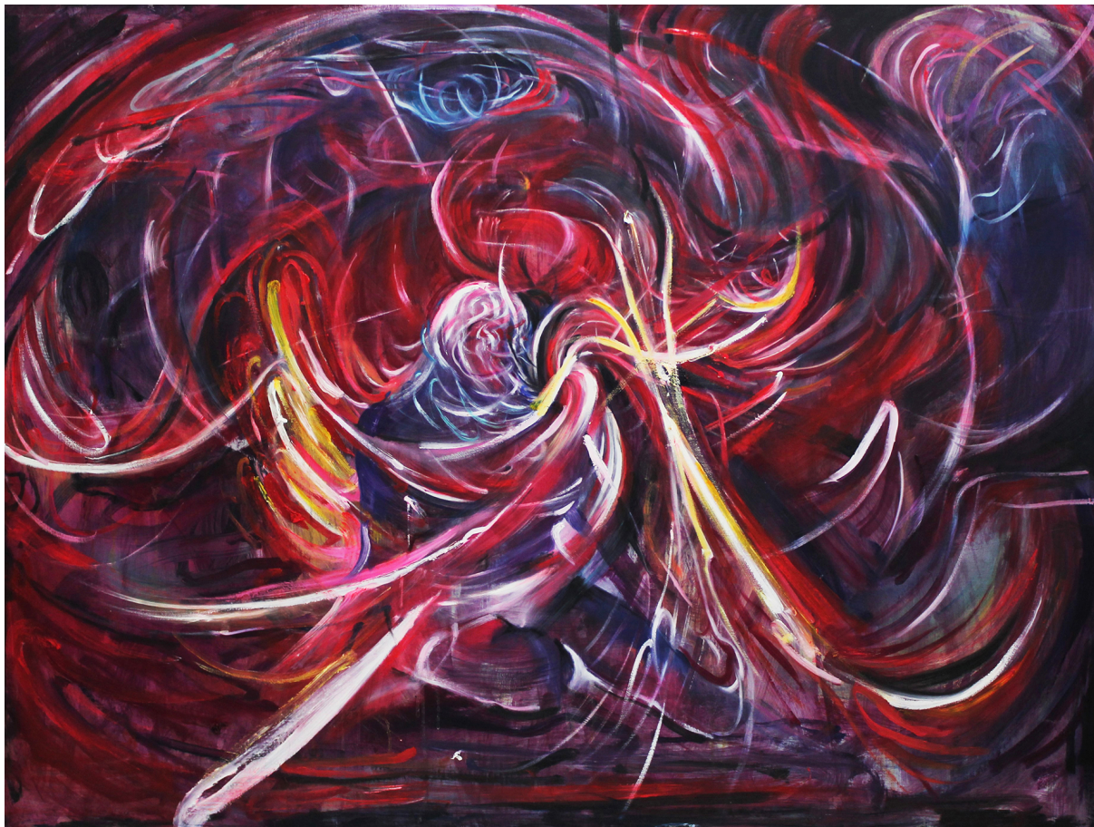
《混沌 I》120 x 160 cm 布面油画 2023 Chaos I 120 x 160 cm Oil on canvas 2023