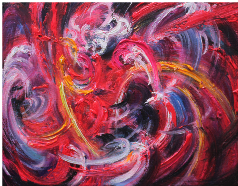
《太阳光》 30 x 40 cm 布面油画 2023 Sunlight 30 x 40 cm Oil on canvas 2023