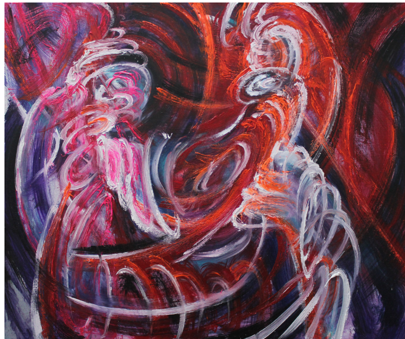
《行走》 50 x 60 cm 布面油画 2023 Go on Foot 50 x 60 cm Oil on canvas 2023