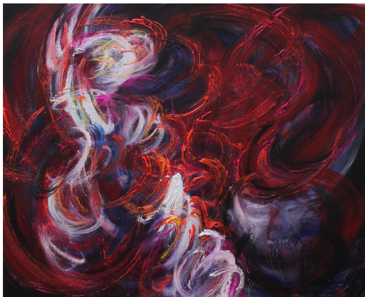
《灵魂之海》 40 x 50 cm 布面油画 2023 The Sea of Souls 40 x 50 cm Oil on canvas 2023