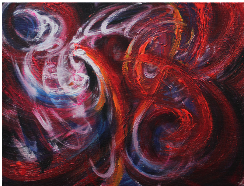
《湍流 II》 30 x 40 cm 布面油画 2023 Turbulence II 30 x 40 cm Oil on canvas 2023