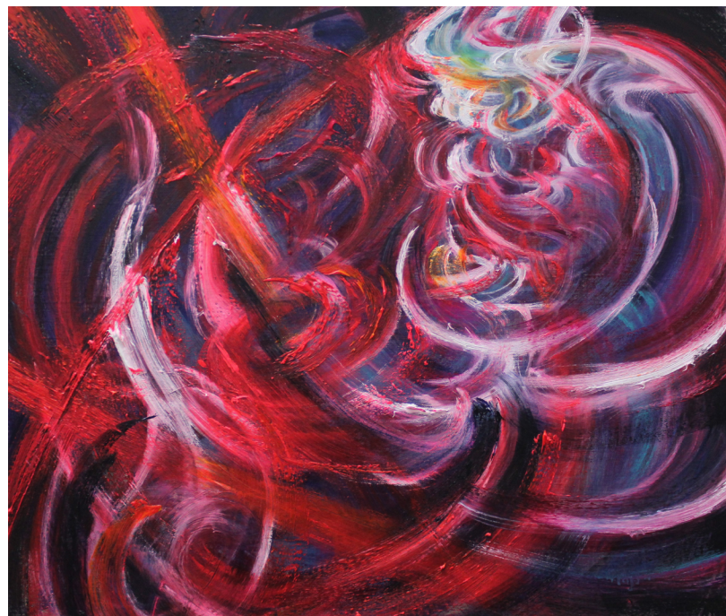
《出逃》 50 x 60 cm 布面油画 2023 Run Away 50 x 60 cm Oil on canvas 2023