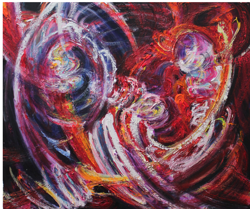
《吸引域》50 x 60 cm 布面油画 2023 Attractor 50 x 60 cm Oil on canvas 2023