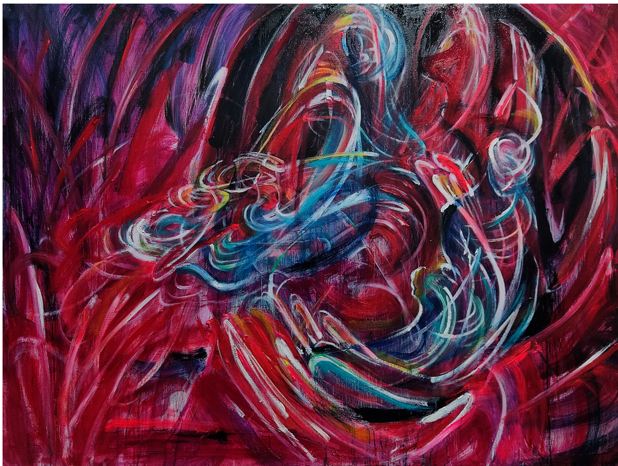
《混沌 III》120 x 160 cm 布面油画 2023 Chaos III 120 x 160 cm Oil on canvas 2023