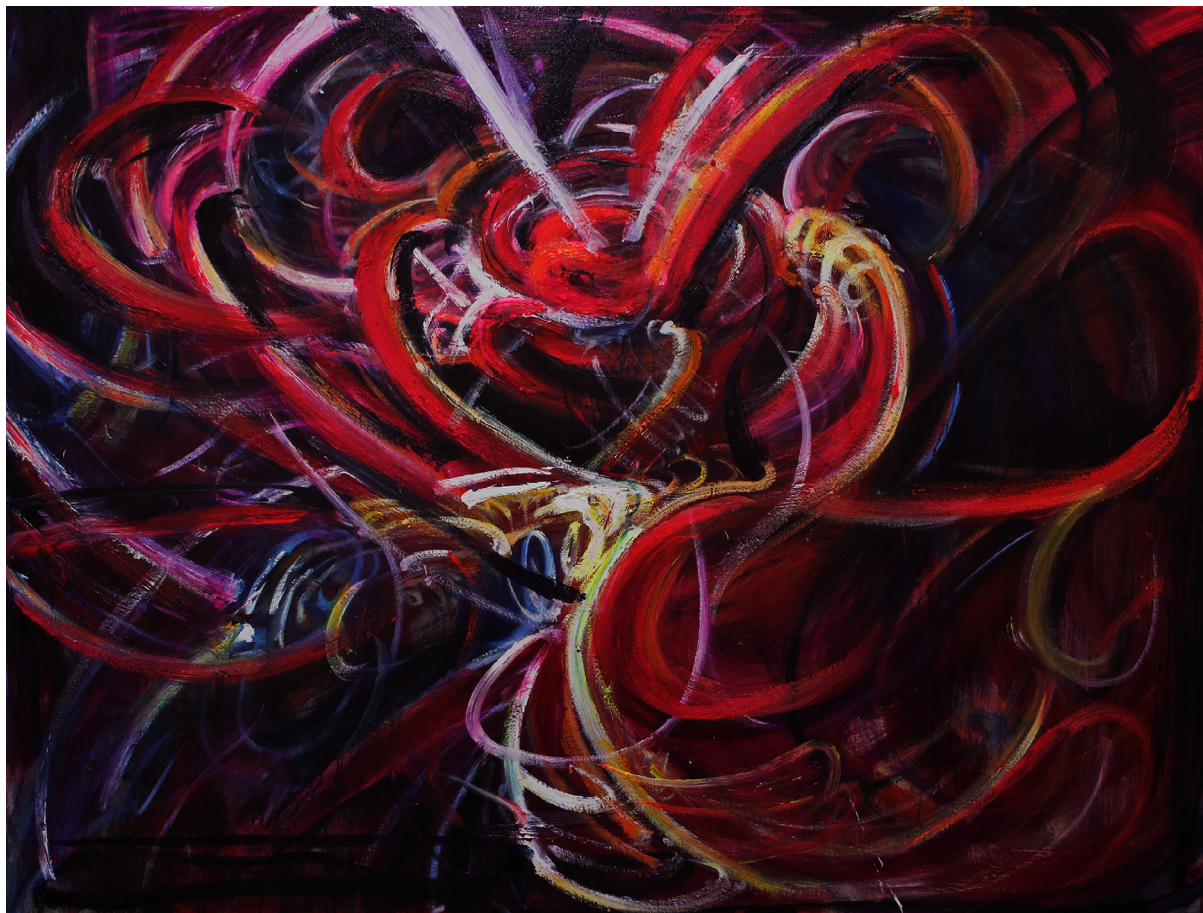
《秩序与混乱并存》 120 x 160 cm 布面油画 2023 Order and Chaos 120 x 160 cm Oil on canvas 2023