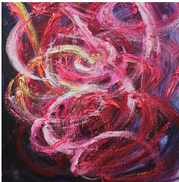
《面部轨迹》30 x 30 cm 布面油画 2023 Facial Trajectory 30 x 30 cm Oil on canvas 2023