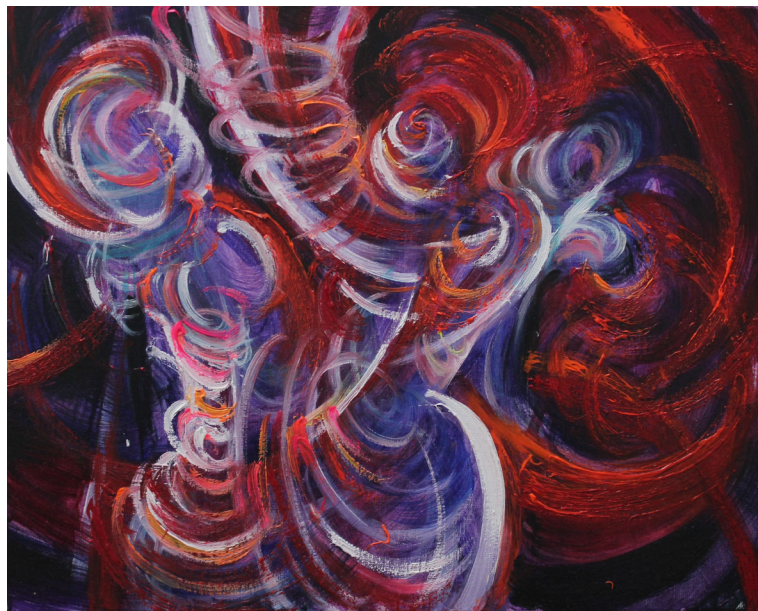
《圆筒旋转》40 x 50 cm 布面油画 2023 Cylinder Rotation 40 x 50 cm Oil on canvas 2023