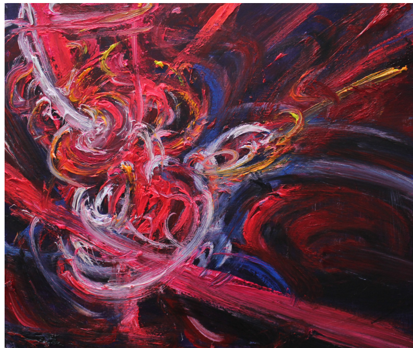
《聚合》50 x 60 cm 布面油画 2023 Polymerization 50 x 60 cm Oil on canvas 2023