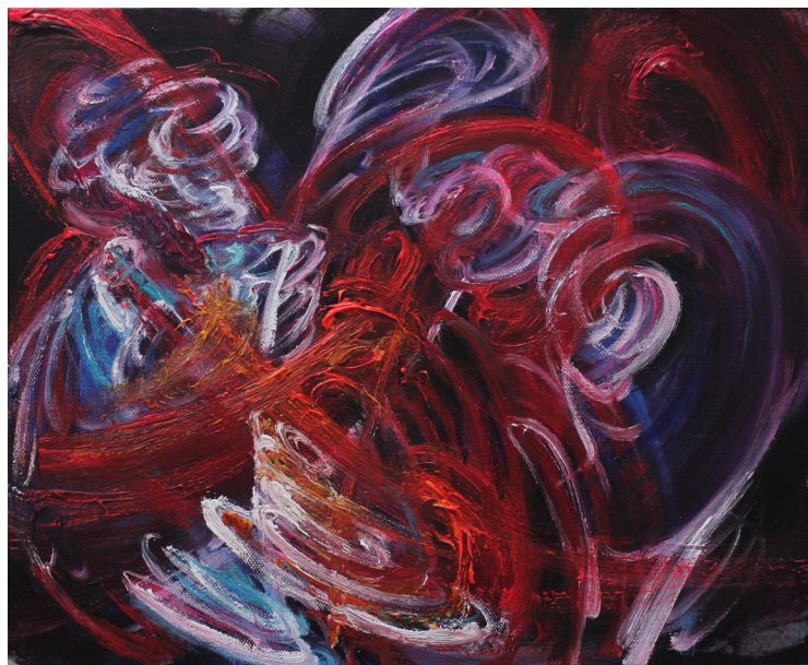
《冲突》40 x 50 cm 布面油画 202 Conflict 40 x 50 cm Oil on canvas 2023