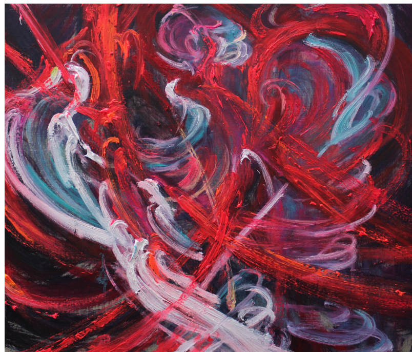
《岛屿分子》 50 x 60 cm 布面油画 2023 Island Elements 50 x 60 cm Oil on canvas 2023