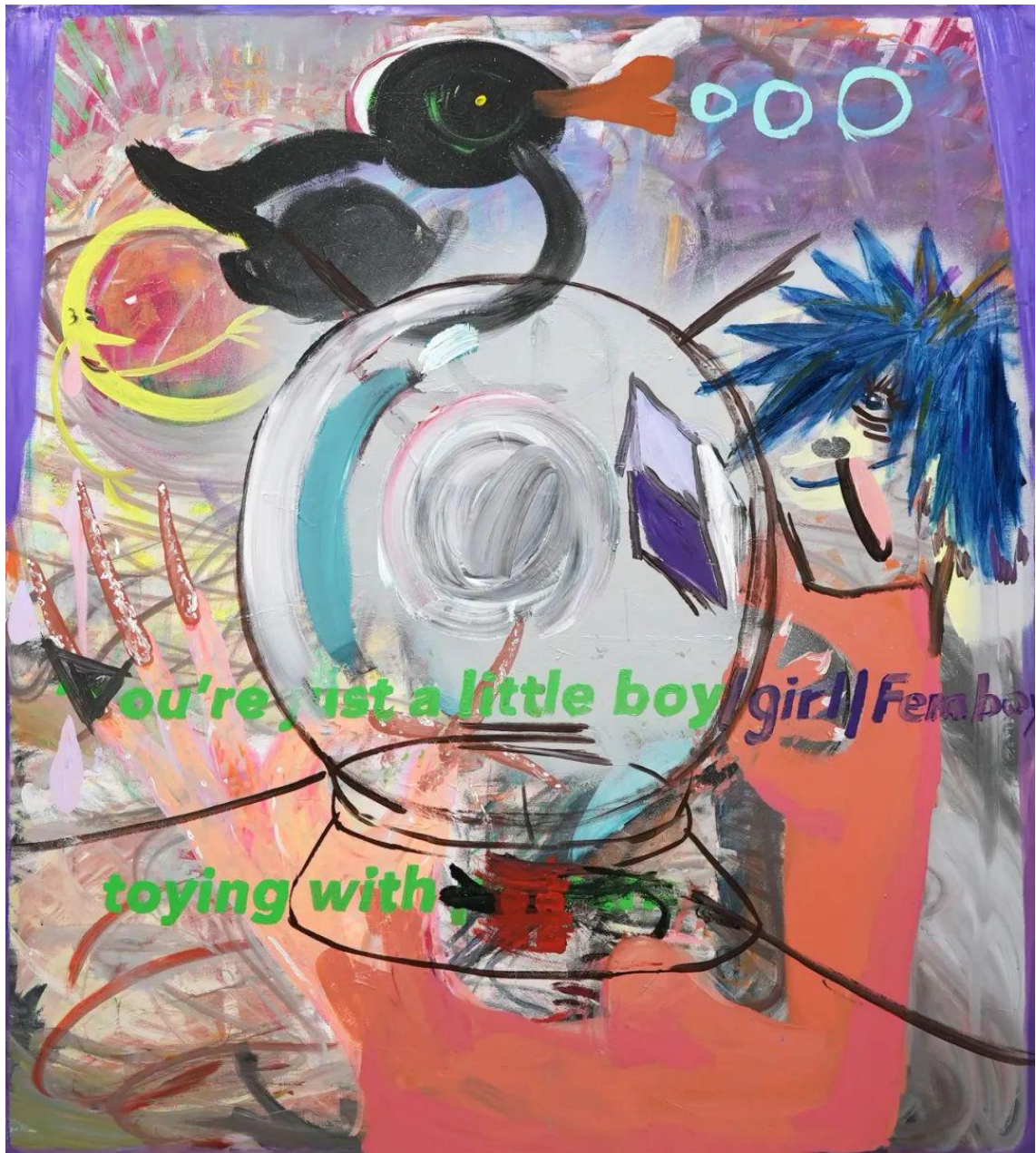
在派对中尖叫，如雨中泪1，布面丙烯，200×180cm，2023

i：你们中的很多成员都是很成熟，也被画廊代理的艺术家。从组建之初，就带有了一定的市场属性，你们怎么看待ONS和创作以及市场的关系？