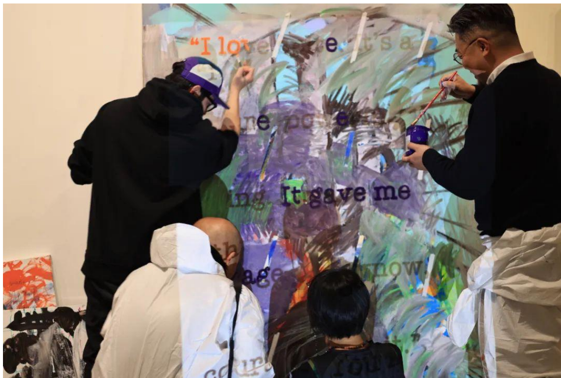
“在派对中尖叫，如雨中之泪”，活动现场，2023