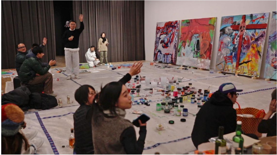
“在派对中尖叫，如雨中之泪”，活动现场，2023