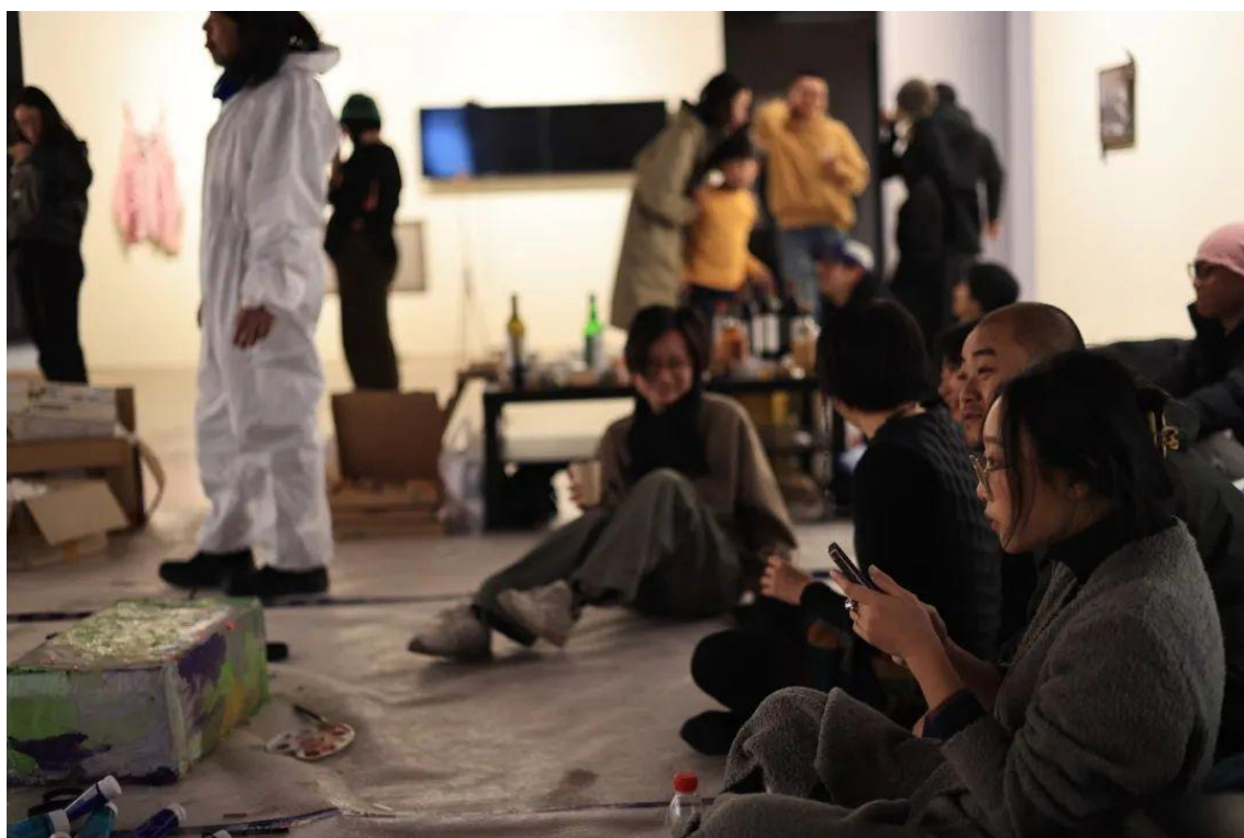
“在派对中尖叫，如雨中之泪”，活动现场，2023