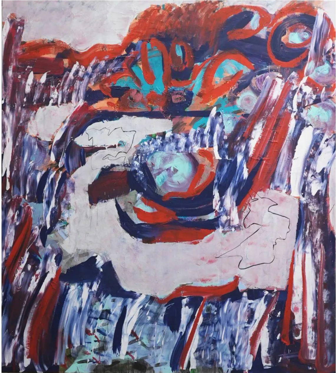
在派对中尖叫，如雨中之泪 2，布面丙烯，200×180cm，2023